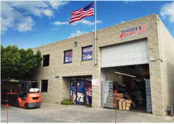
Forklift สำหรับรับสินค้าขนาดใหญ่/น้ำหนักมาก