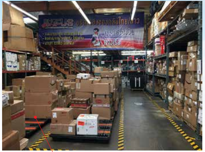
จัดเก็บสินค้าทุกชั้นอย่างมีระบบ บนชั้นวางของ และ pallet